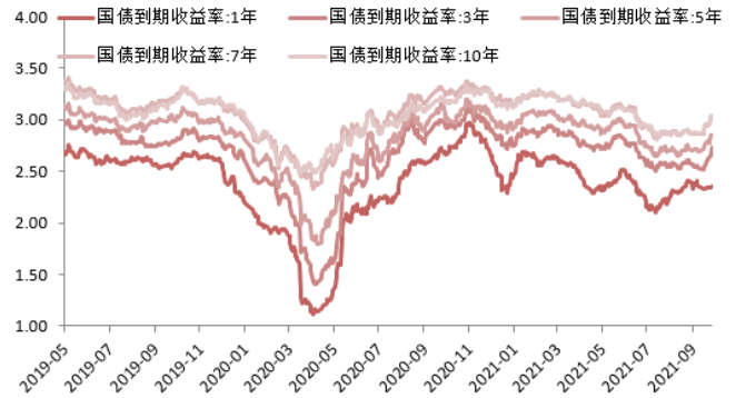
图 2:国债收益率曲线和每日变动