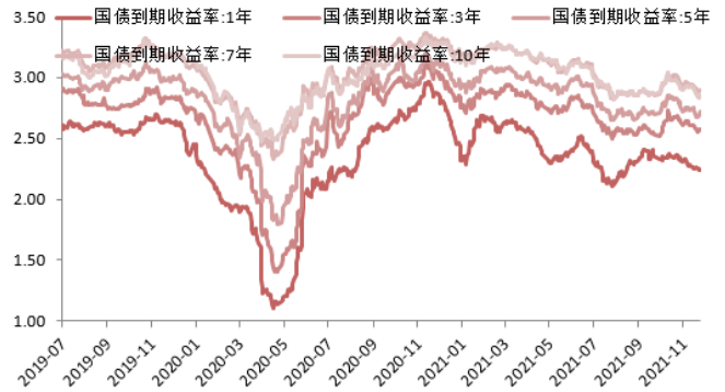
图 2:国债收益率曲线和每日变动