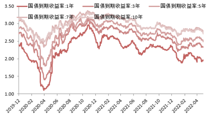
图 2:国债收益率曲线和每日变动