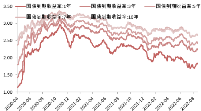
图 2:国债收益率曲线和每日变动