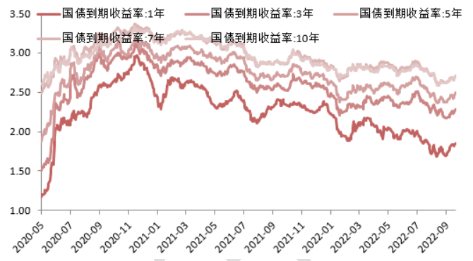
图 2:国债收益率曲线和每日变动